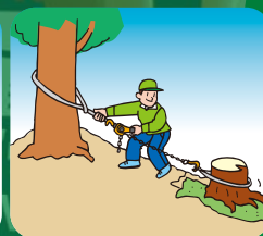
引張り 引寄せ作業