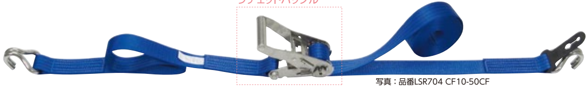
ラチェットバックル