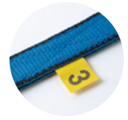
長さが分かるタグ付き。 (写真は3m)