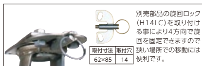
取付寸法 取付穴 62×85 14

別売部品の旋回ロック (H14LC) を取り付ける事により4方向で旋回を固定できますので狭い場所での移動には便利です。